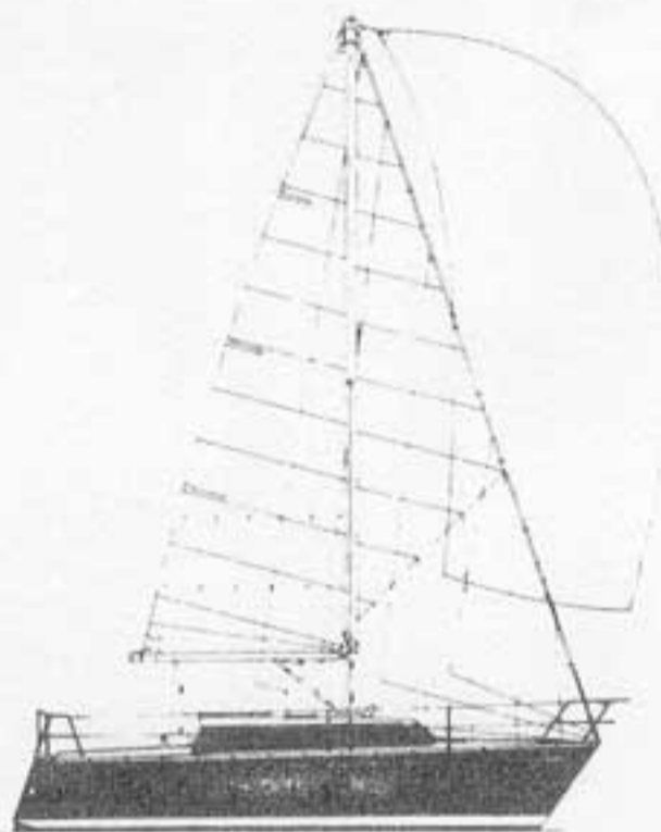
De Dufour 2800 in zij-aanzicht

De ingebouwde Volvo Penta diesel-motor, type MD 7A van 13 pk, is ruim bemeten voor het schip en voldoet goed. De motorinbouw is goed uitgevoerd doch de fundatie is minder star, waardoor trillingen van de motor ondanks de elastische opstelling vooral bij het kritische toerental merkbaar zijn in de romp. De schroefas is voorzien van een watergesmeerd rubber lager. De uitlaatgassenleiding is watergeïnjecteerd en voorzien van een